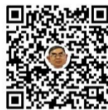
创新方法科普 快手号：TR17_ma_2020