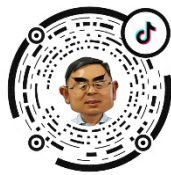
创新方法科普 创新方法知识传播...

3. 培训材料。通过抖音、快手、微信视频号、小红书、B站等平台领取观看材料。二维码如下：